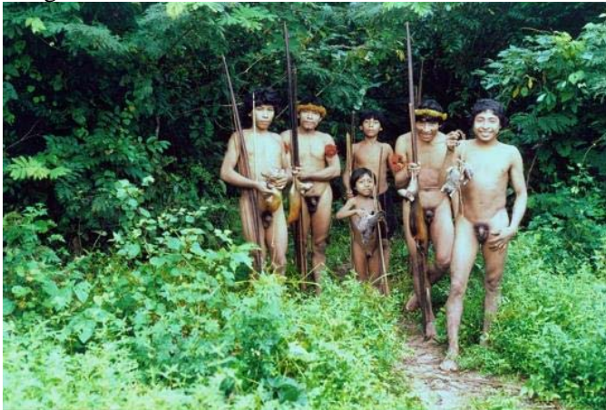
Los Awa, grupo no contactado pero bien protegido en el Brasil | Fotos Survival

El análisis muestra cómo la deforestación —la destrucción de la masa forestal— disminuye sustancialmente en lugares donde los pueblos indígenas continúan viviendo en las áreas protegidas y no se los obliga a marcharse de ellas. Este dato se debe al fuerte vínculo que existe entre un pueblo indígena y su territorio y el respeto fundamental que las comunidades indígenas tienen hacia los ecosistemas de los que dependen. Según la organización conservacionista WWF, el 80% de las “ecorregiones” más ricas del mundo están habitadas por comunidades indígenas.