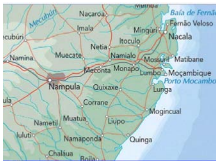
Mapa de Nampula y alrededores

Las dos monjas fueron a Mozambique en 1973, estableciéndose en Nampula, inicialmente en un terreno que les cedió una comunidad de combonianos, y con posterioridad en un monasterio -nacionalizado al obispado- que les cedió el gobierno. Desde entonces, tras diversos acontecimientos políticos difíciles como la guerra por la independencia del país y la llegada del comunismo, vienen desarrollando sus tareas de contemplación -comunidad contemplativa, con las puertas abiertas a todos- y acompañamiento a las comunidades cristianas que han ido surgiendo ("Iglesia viva, ministerial, las y los laicos asumen todo, menos la misa"), formación de monjas, trabajo en el campo y en los poblados cercanos, atención a pobres, enfermos, refugiados, viudas... y fundamentalmente acogida de niños y niñas huérfanos, más de 60 en el monasterio, además de atención a los meninos da rua que viven en las proximidades de la catedral de Nampula.